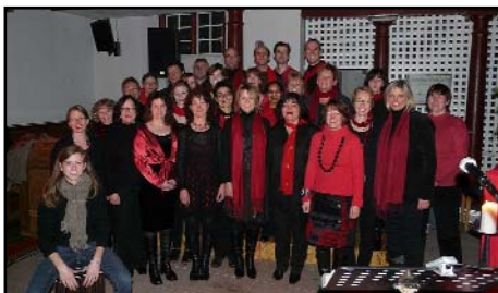
Der Chor „Nah dran“ an Weihnachten 2010 in der Westerfelder Kirche

den); der andere führte zu dem 1998 gegründeten Westerfelder Gospelchor "Nah dran", der ihn weit über Westerfeld