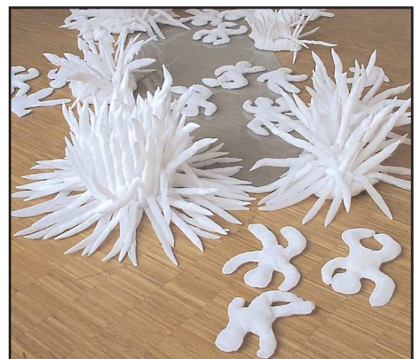
„Nature“, Installation, Detail

Schaffensperioden. Sie begann ihren Weg als Modedesignerin, wandte sich dann der Malerei und Illustration zu und entdeckte danach ihre "textile" Seite wieder; so entstanden Textilreliefs wie in der Serie "Grands".