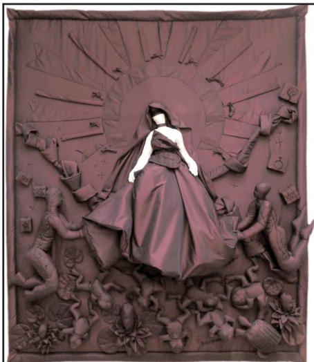
„Innocencia“ (Textilrelief aus „Grands“)