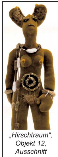
„Hirschtraum“, Objekt 12, Ausschnitt

Doch nun zu ihrer eigentlichen künstlerischen Arbeit! Sie arbeitet gern an Themen bzw. Themenbereichen, die teilweise einer längeren zeitlichen Vorbereitung bedürfen; die Ausführung erfolgt dann relativ schnell. Sie bezeichnet sich selbst als "schnell-langsame Arbeiterin", was ja eigentlich ein Gegensatz ist. - Aber wir kennen wohl alle das Phänomen, dass sich bestimmte Projekte langsam in uns entwickeln und wir sie dann relativ zügig umsetzen. - Das gefundene Thema wird dann von allen Seiten beleuchtet und in verschiedenen Arbeiten und Materialien dargestellt, z.B. "Hirschtraum" (Gouache auf Nessel), ein Ausstellungskonzept, bestehend aus Malerei und textilen Installationen / Objekten; es beleuchtet zwischenmenschliche Machtsituationen. Andere Projekte sind z.B. der "Weg" zum Thema ROSE FAUNO (Liebe, Leben, Zeit, Tod) in Videotechnik oder die Installation "Nature" (siehe Objektbeispiel, re. Spalte).